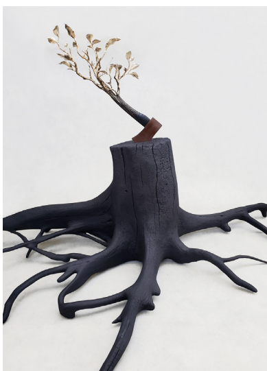
Ghyslain Bertholon Rezilientia , 2023 - EA N°1/4 Bois brûlé, bronze, or (Édition de 8 + 4 EA) 140 x 90 x 115 cm

À travers ses œuvres, il met en lumière l'intenable position du plus clairvoyant des animaux rendus aveugles.