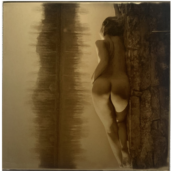
Anne Kuhn Miroir Orotone sur verre, caisses américaines en bois 20 x 20 cm / 23 x 23 cm encadré