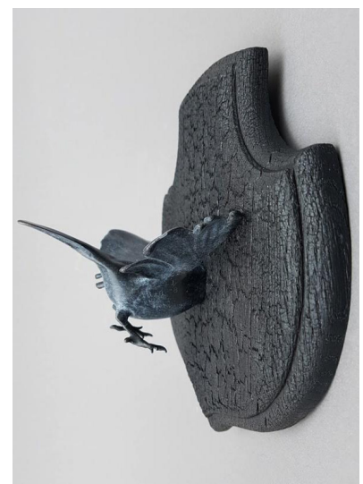
Ghyslain Bertholon Série des « Trochés de face » , 2020 - bronze patiné et bois brûlé (Édition de 8 + 4 EA) 22.5 x 22.5 x 12cm